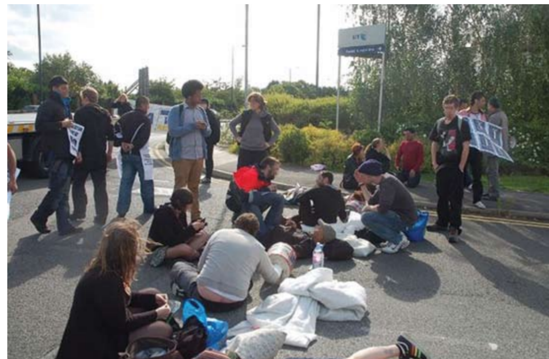
Juni 2011: Een blokkade bij uitzetcentrum UK verhindert massa-uitzetting per charter naar Irak.

Deze organisaties zullen op hun beurt gevoerd worden door groepen die daar weer 'onder' te vinden zijn. Hierbij denken we bijvoorbeeld aan het Landelijk