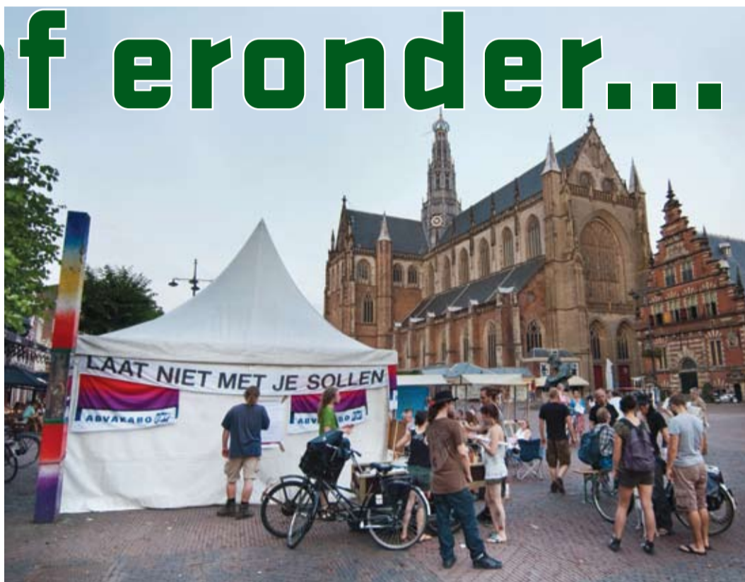
Stakende werkers in de thuiszorg hebben een tent opgezet voor het gemeentehuis in Haarlem. Ze willen niet dat hun loon met 25% verlaagd wordt tot minder dan 10 euro per uur.

samenleving wil opbouwen buiten de commerciële wereld om, iedereen die oud is, kunstenaars en "asocialen", iedereen die huur betaalt, alle arbeiders die van hun loon niet alle levenskosten kunnen betalen en degenen die binnenkort ontslagen zullen worden.