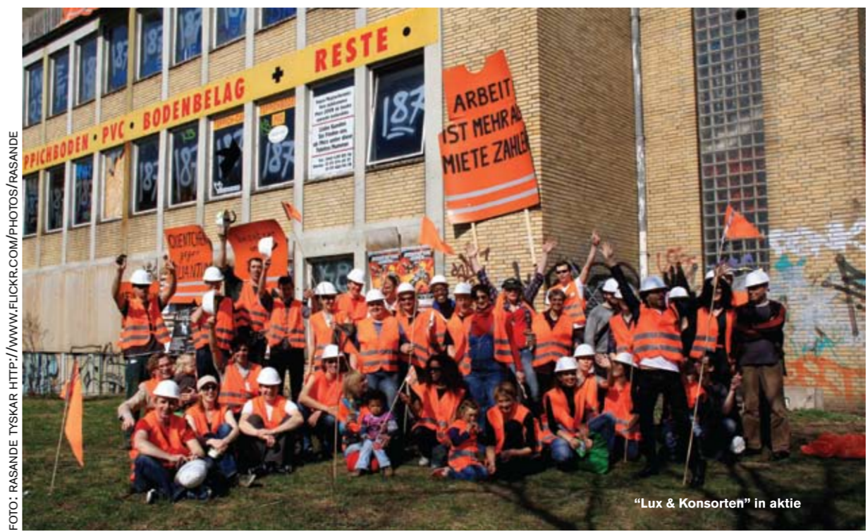
"Lux & Konsorten" in actie